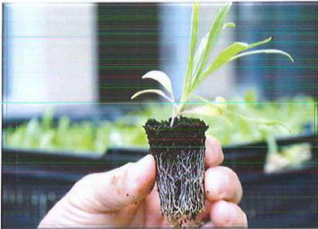
Fidantët e rinj të certifikuar të mbjellë në Luginën e Zllupës