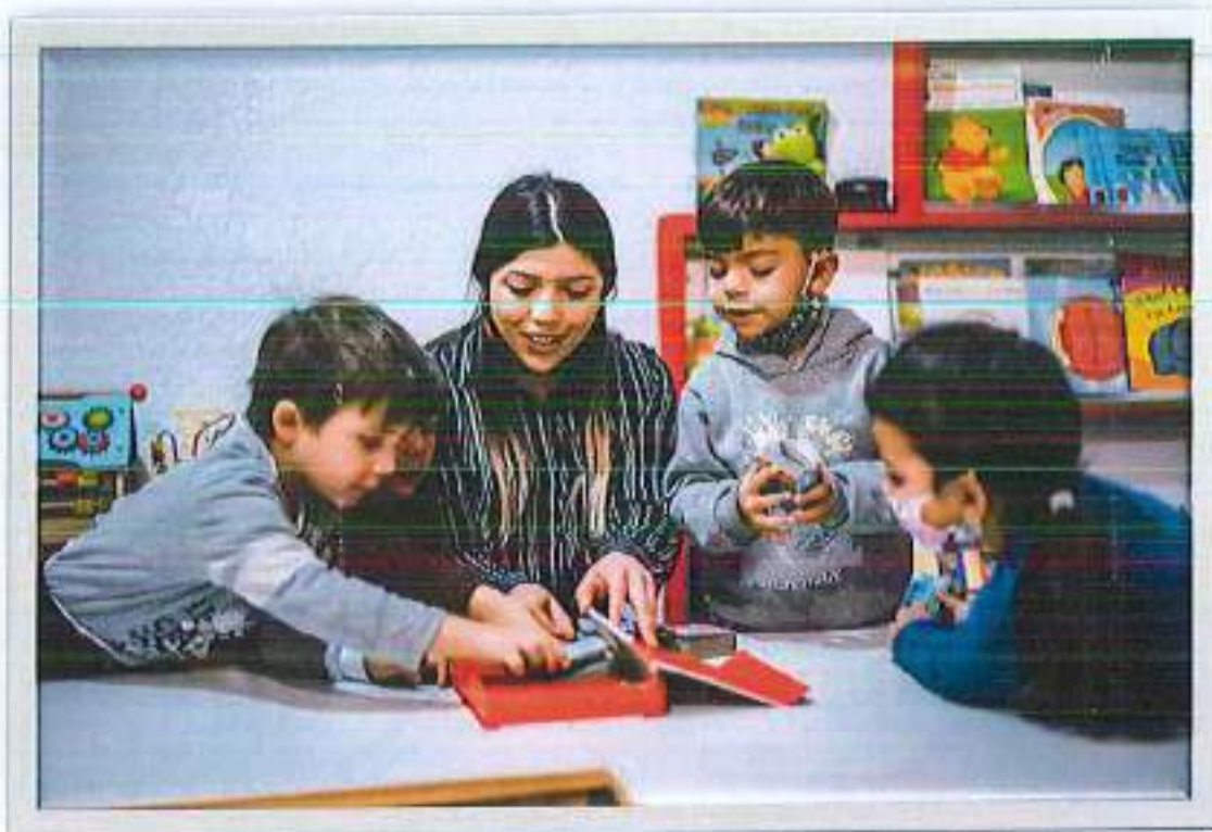
Edukatoga e nivelit paunshkollor e përkatësisë romë duka luajtur me fëmijë të përkatësive të ndryshme etnike